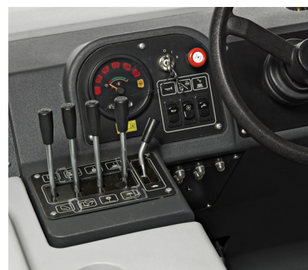
Przejrzyste i łatwy w obsłudze panel kontrolny