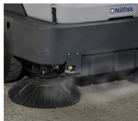
System DustGuard™ (standard w wersji MAXI) efektywnie kontroluje unoszący się pył poprzez wytwarzanie mgiełki wodnej zraszającej miotły