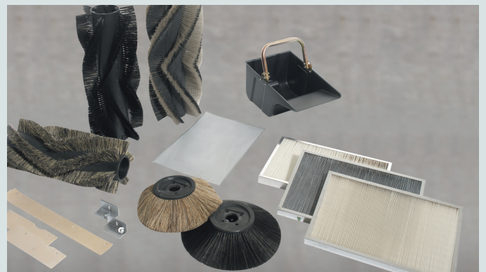
Szeroka gama akcesoriów pozwala na dobór odpowiednich rozwiązań pod konkretne zadania.