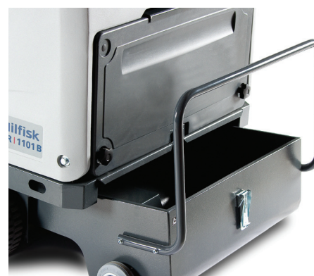
Duża pojemność zbiornika, aby wydłużyć czas pracy