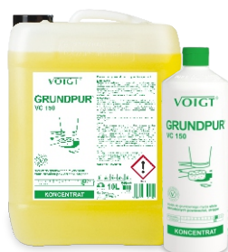
GRUNDPUR VC 150 przygotowanie podłoża